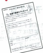
1封封の応募用紙にご感想を書いてFAXしてください。

日新堂新聞 結を読んでのご感想やエコ名刺を使った感想をお寄せ下さい! 『こんな反応があった』『こんなデザインはどう?』『こんな素材でエコ名刺ができないか?』などなどご意見もお待ちしております。お客様の声から新しい商品が生まれるかもしれません!