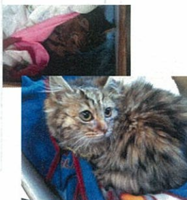
▲ぐったりしていたネコちゃんがこんなに元気に！良かった！

地球上の全ての命はかけがえのない大切なものです。弊社のスタッフ全員が徹身的にネコちゃんのために、部屋を片付けてあげたり、病院へ連れて行ったり、本心に心からネコちゃんのために行動して見たい姿を見て感動しました。 仕事で忙しいのに時間がある限りネコちゃんの看病をしてあげます。人は愛を土台にして生きていきます。人へのやさしさこそ世の全ての生命に対するやさしさ。一番大切な事を体験できたと思います。 地球上の全ての命はかけがえのない大切なものです。弊社のスタッフ全員が徹身的にネコちゃんのために、部屋を片付けてあげたり、病院へ連れて行ったり、本心に心からネコちゃんのために行動して見たい姿を見て感動しました。 仕事で忙しいのに時間がある限りネコちゃんの看病をしてあげます。人は愛を土台にして生きていきます。人へのやさしさこそ世の全ての生命に対するやさしさ。一番大切な事を体験できたと思います。