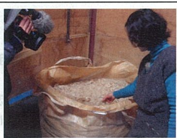
▲こちらが埼玉にあります、優良パルプ普及協会さんです。写真はパルプ製造工場にある、バナナペーパーになる前の乾燥したバナナの茎です。