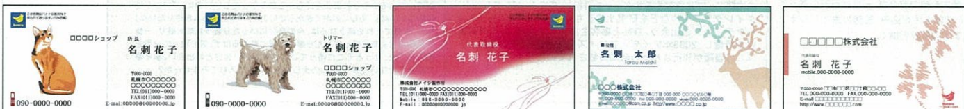
AJOカラフルデザイン シリーズ 横067 AJOカラフルデザイン シリーズ 横066 AJOカラフルデザイン シリーズ 横049 ECO鹿 ピンククローバー

※新着デザインが続々とアップされていますので、ホームページもチェックしてくださいね。