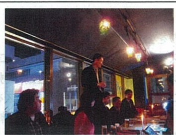
▲東京でエコ名刺交流会。みなさん初対面ですが、あっという間にうちとけていました。次回から定期開催をいたしますので、皆さんぜひご参加くださいませ！ HPとメルマガ等で告知させていただきます。