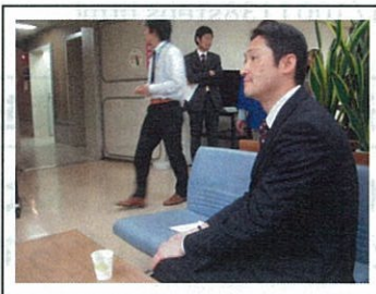
▲わかりますかね？ 超緊張してます。背中が丸くなってます、目が泳いでます、おしっこが近いです…(笑)。

▲人生初の楽屋。 この中に入ると更に緊張してドキドキします。 でもって、下の写真がお弁当。緊張でノドを通らないと思いきや、全部おいしくいただきました(笑)。何がすごいかってシャケ！厚さが違うのと、北海道でもなかなか食べられないおいしい味付け。